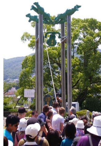
平和公園内「長崎の鐘」